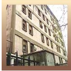
Hospital Tobar García