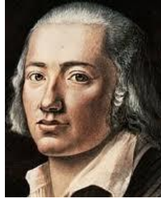
Hölderlin Poeta (1770–1843)

Tanto si decimos "sí" o si decimos "no", cuando la decisión se basa en algún miedo, tendremos que justificarla e internamente nos sentiremos inseguros porque nuestro corazón no está ahí. Una decisión basada en el temor y con el objetivo de mantener una aparente seguridad, paradójicamente, nos mantiene inseguros por dentro. No hemos sido sinceros con lo que sentimos.