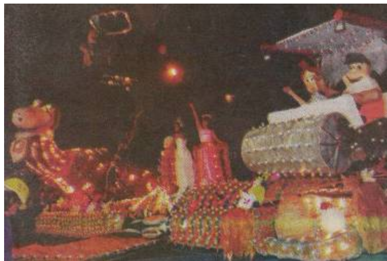
Desfile de carrozas construidas por adolescentes en celebración de la Fiesta Nacional de los Estudiantes, en San Salvador de Jujuy, el 21 de septiembre