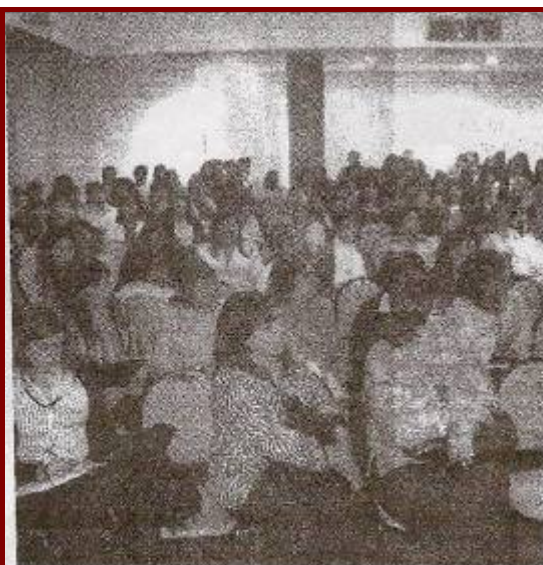
blico concurrió a la disertación sobre suicidio en adoles- da en esta ciudad.